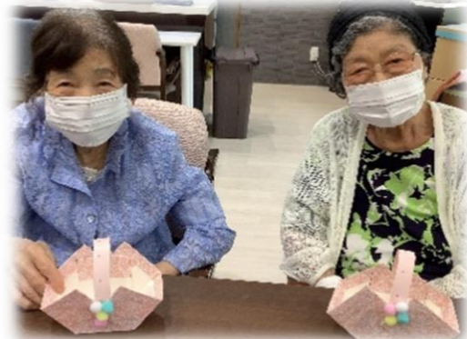
ミニバスケット作り