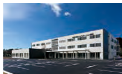
季美の森リハビリテーション病院