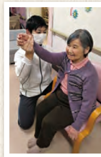
PTによるリハビリ風景