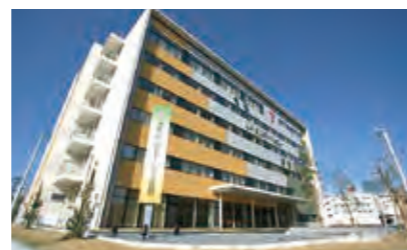
令和リハビリテーション病院