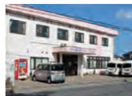
九十九里介護センター