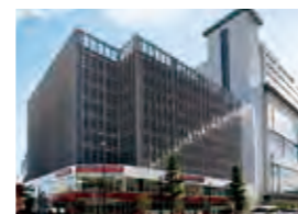
千葉きぼーるクリニック