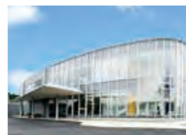
季美の森整形外科