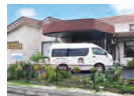
姫島介護センター